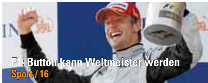
F1: Button kann Weltmeister werden Sport / 16