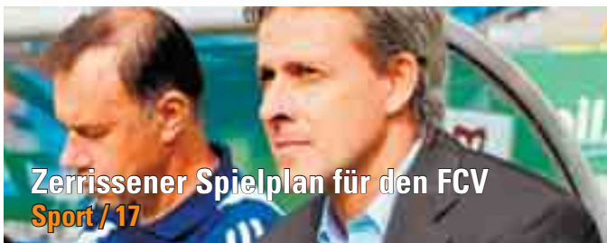
Zerrissener Spielplan für den FCV Sport / 17