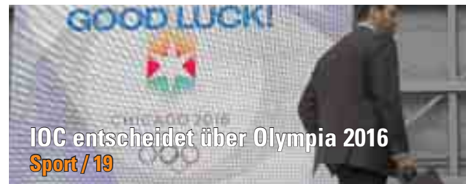
IOC entscheidet über Olympia 2016 Sport / 19